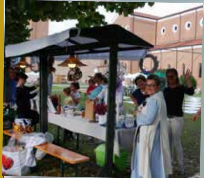
Le Bancarelle delle Contrade